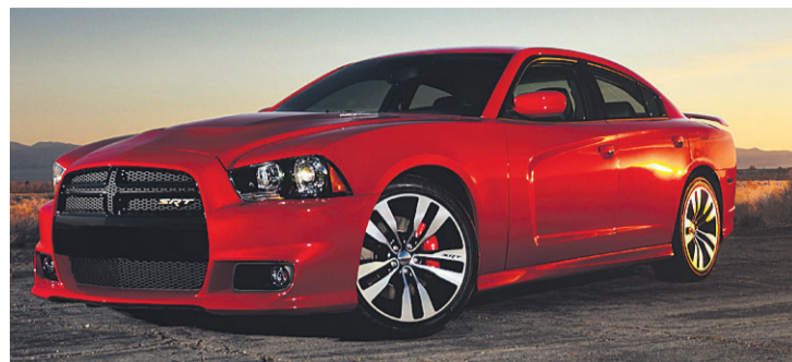
ULTIMATE: 2012 Dodge Charger SRT8: Den ultimate Charger, lanseres som 2012-modell til høsten.

Chryslerkonsernet er på hugget og planlegger en massiv utrulling av nye produkter. Først ute er en ny og vakkert redesignet Dodge Charger.