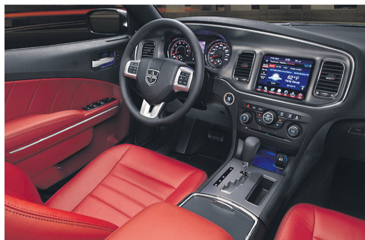
STILRENT INTERIØR: Dodge Charger er løftet markant på interiørsiden. Her standardutgaven med ryddig og oversiktlig dashboard. Modellen er opp flere hakk fra sin forgjenger hva gjelder materialvalg.

» En av de tøffeste firedørsbilene vi noen gang har sett, rett og slett en nytelse for øyet.